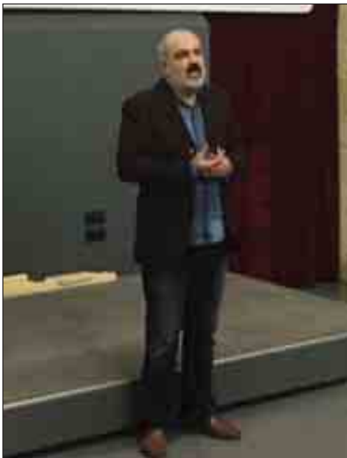
L'incontro con il regista Alessandro Scillitani

lista a cui il film Alla Ricerca d'Europa ha fatto da puntolo per continuare a viaggiare e cominciare a cercare l'Europa proprio nel Mediterraneo, che, come diceva l'intellettuale serbo croato, Predrag Matvejevic, finisce quando l'ulivo non c'è più. Nel film traspare l'euforia del giornalista e scrittore, Paolo Rumiz, narratore ineccepibile. Sottotitoli in inglese, "of course", siamo europei. Rumiz e le sue parole commuovono ed è quello che il film racconta anche attraverso le immagini di un'alba che esplose alle sei del mattino, generando i cinque versi dei galli delle Cicladi. Con Scillitani parla l'intellettuale Piero Tassinari. È lui che nel film traduce l'Odissea di Omero dal greco antico e che, raccogliendo bottiglie di vino da bere